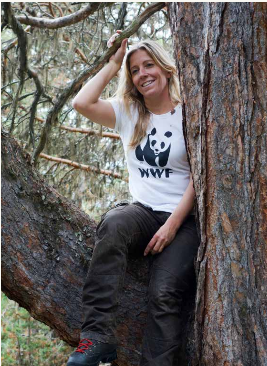
Våren 2016 vedtok Stortinget at ti prosent av den norske skogen skal vernes – mye takket være mangeårig innsats fra WWF Verdens naturfond. Her besøker jeg verneverdig skog i Lemonsjølia i Oppland.